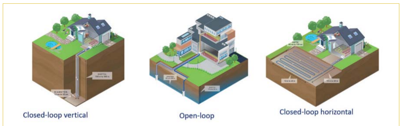
Figura 1 Tipologia di pompa di calore

Impianti per la produzione elettrica e di calore, convenzionali o innovativi a re-immissione totale dei fluidi, sono solo alcune