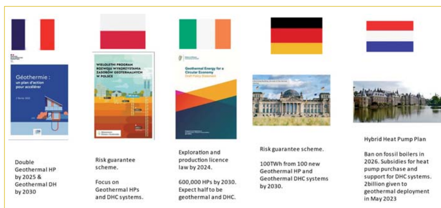
Figura 3 Geotermia in Europa